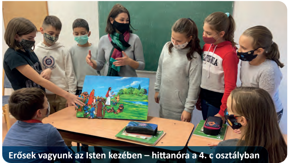
Erősek vagyunk az Isten kezében – hittanóra a 4. c osztályban

Sokunk kérése lehet most egy ilyen lámpás, mely megmutatja, hogy merre menjünk, melyik a helyes, a biztos, a biztonságos út, a békeség, a nyugalom útja. Szükség lenne egy ilyen lámpásra, mert könnyen elveszítjük az utat, kicsúszik lábunk alól a talaj, hibát hibára halmozva egyre jobban süllyedünk, s egyre távolabb kerülünk a kiutat mutató fénytől – a világ világosságától, aki maga Jézus Krisztus. A félelem, a kétségbeesés, a bizonytalanság időszakát éljük, olyan időszakot, amelyben tudom, hogy imára kulcsolják kezüket olyan emberek is, akik talán évtizedekig nem mondtak imát – nem kértek Istentől, nem adtak hálát neki. Belesimul-